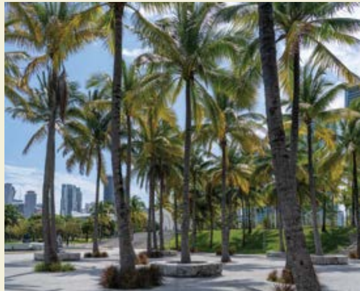
ARRIBA: Miami Beach Golf Club; CENTRO: South Beach; ABAJO: Maurice A. Ferré Park Baywalk