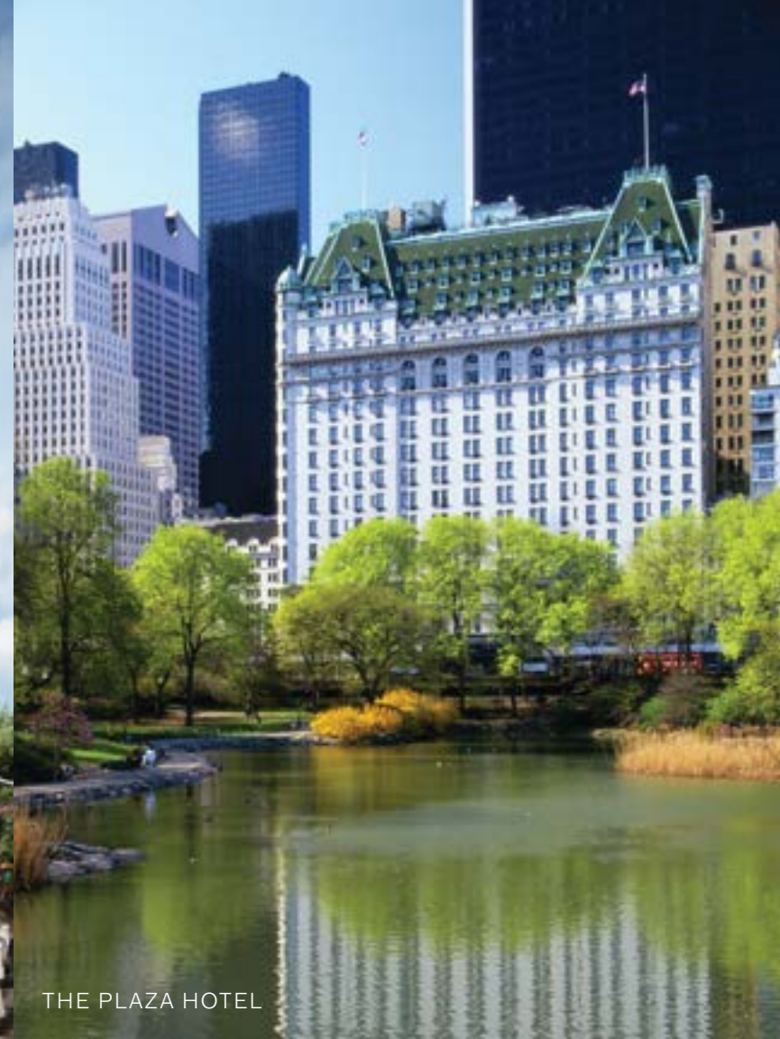
THE PLAZA HOTEL