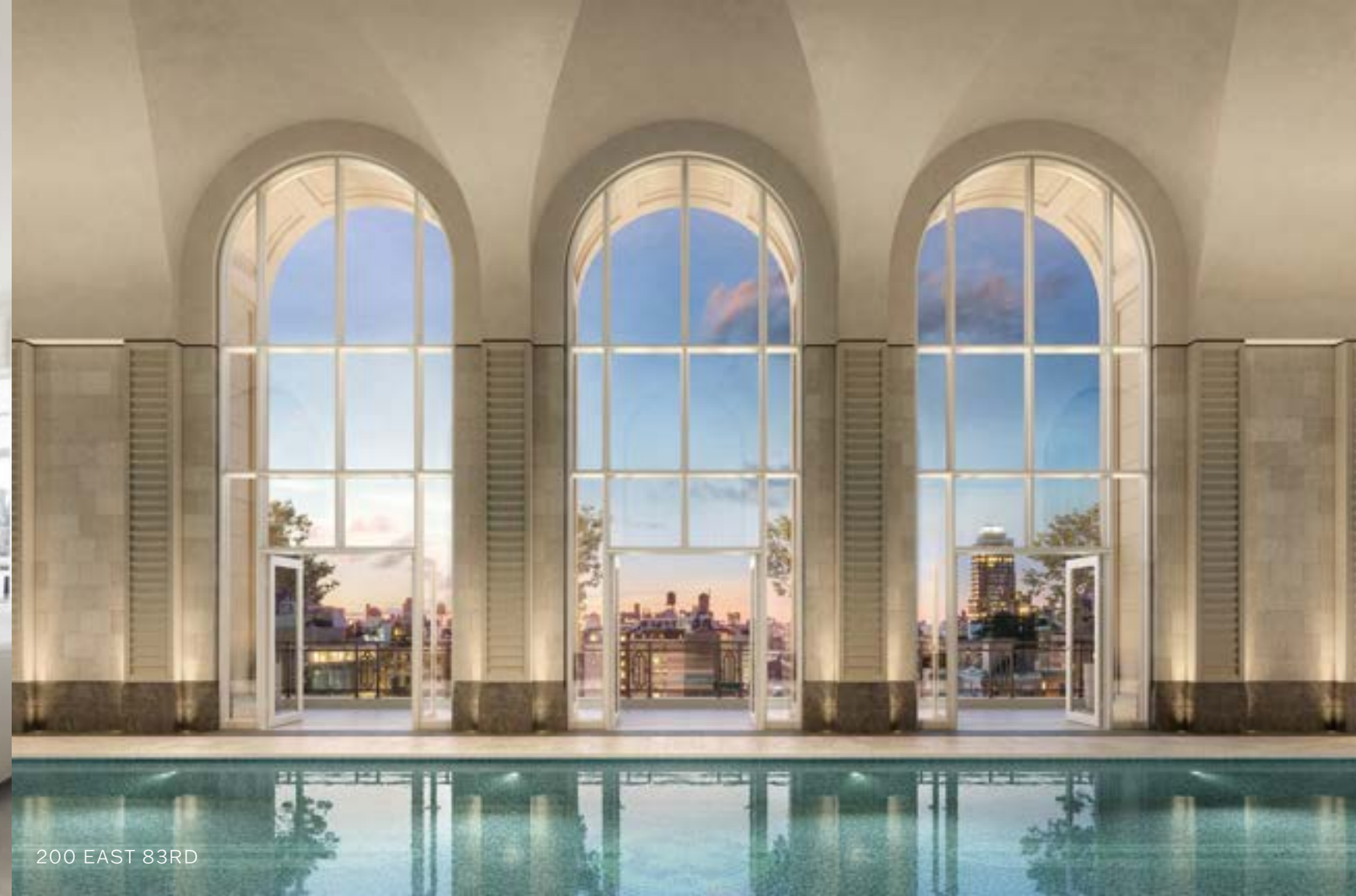
200 EAST 83RD