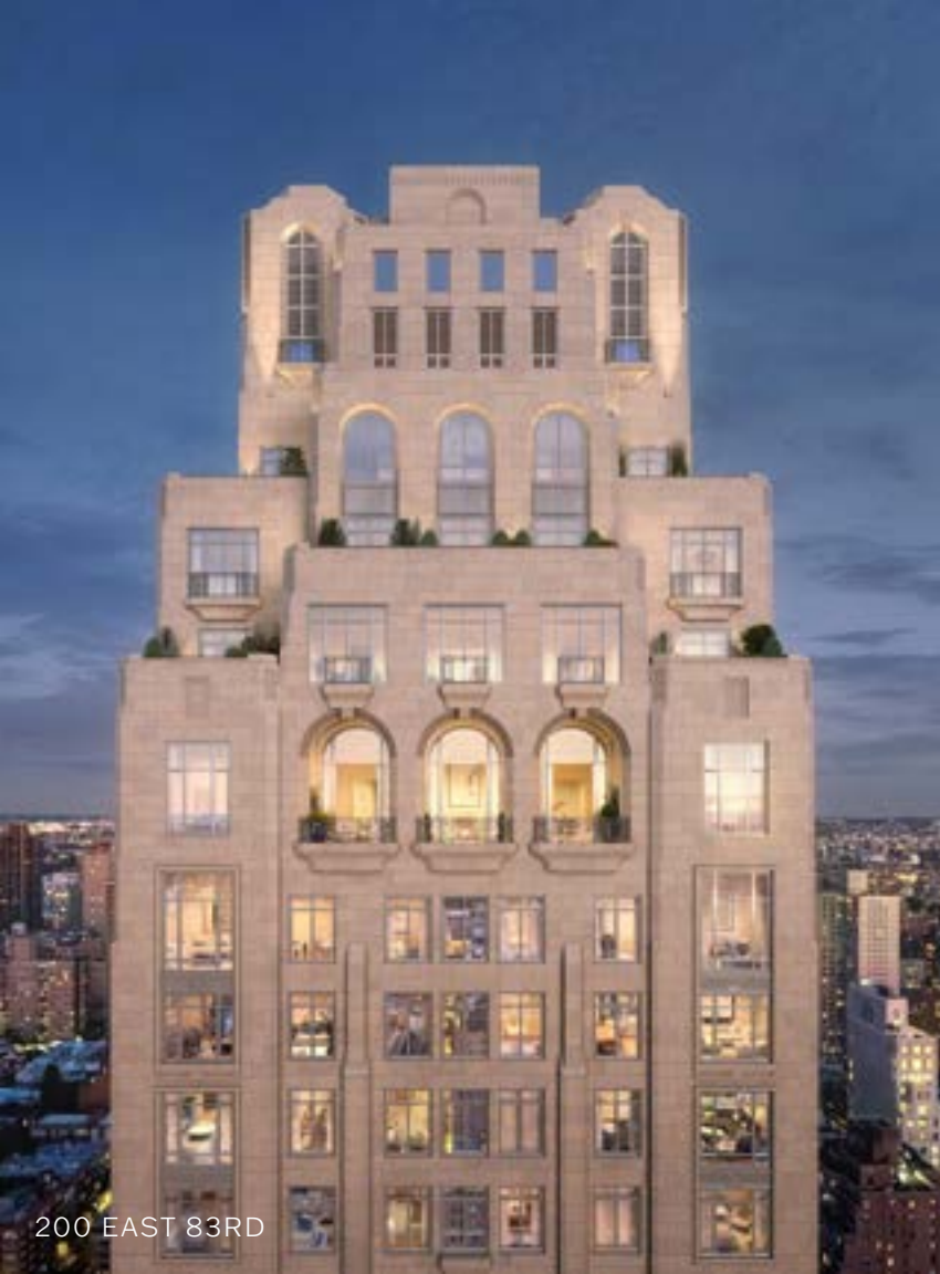
200 EAST 83RD