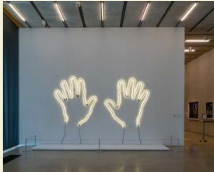
ARRIBA: Wynwood Walls; CENTRO: Penetrável Macaléia, de Hélio Oiticica, Pérez Art Museum Miami; ABAJO: Notes for a Poem on the Third World, de Glenn Ligon, Pérez Art Museum Miami