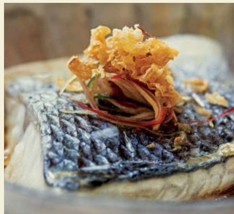
SEXY FISH MIAMI