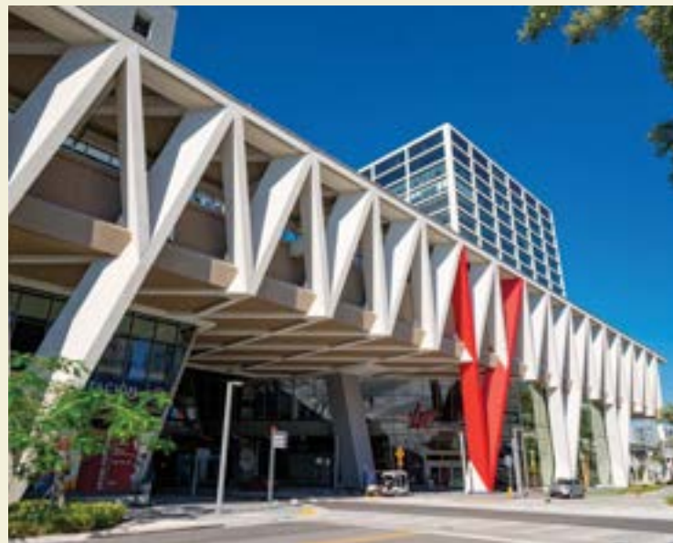
ARRIBA: Miami Metromover; CENTRO: Brightline; DEBAJO: MiamiCentral Train Station