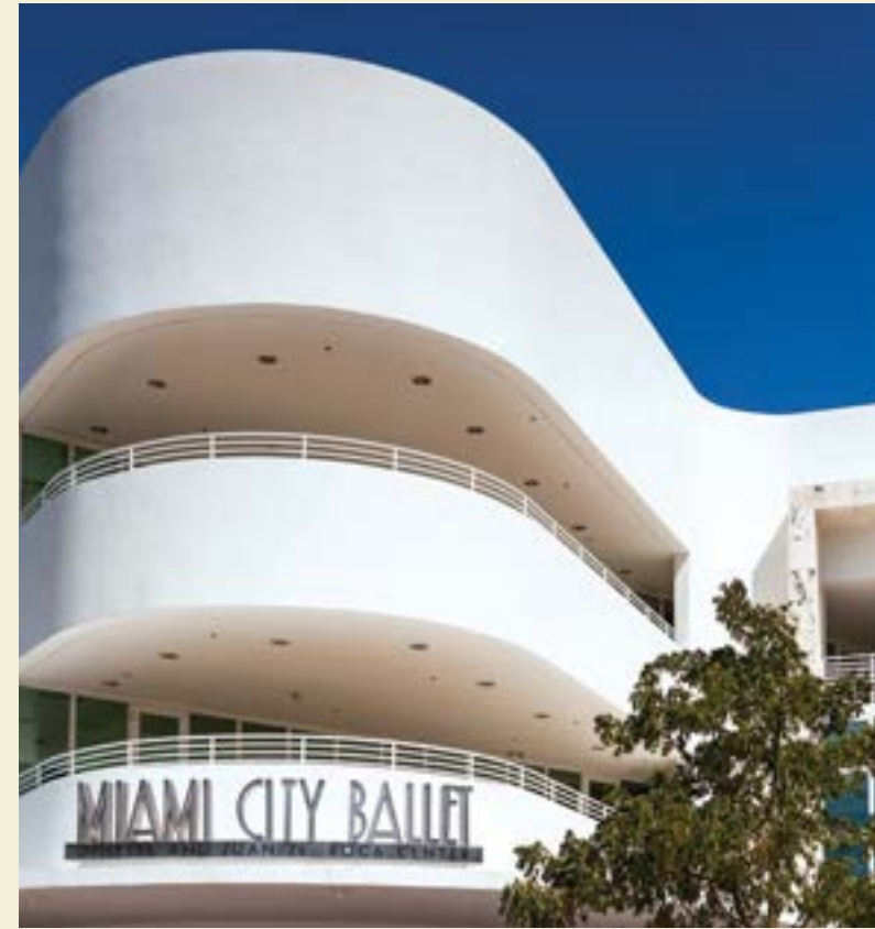
MIAMI CITY BALLET, MIAMI BEACH