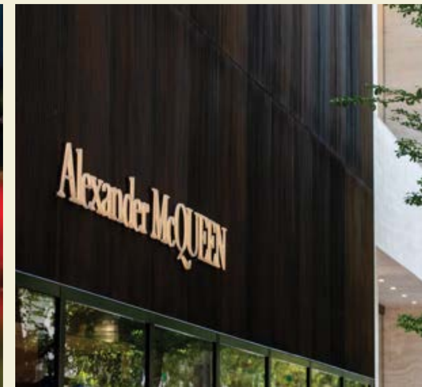
ALEXANDER MCQUEEN, DESIGN DISTRICT