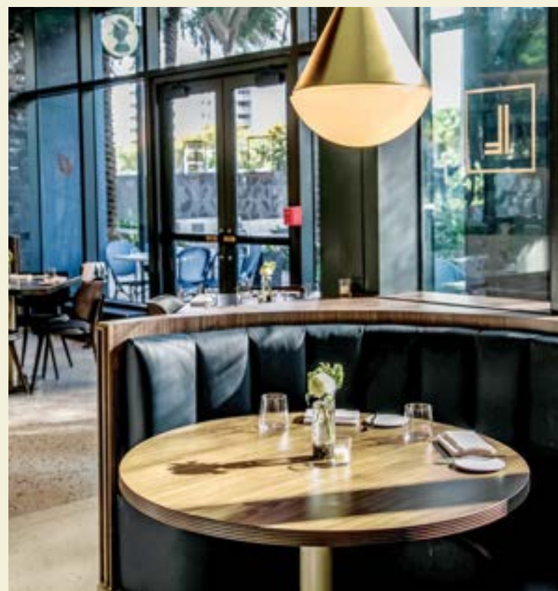
BRASSERIE LAUREL, MIAMI WORLDCENTER

La infinita oferta gastronómica de Miami va desde los restaurantes locales hasta los de fama mundial, con platos tan diversos como las personas que llegan a la ciudad. Varios restaurantes galardonados con estrellas Michelin están a un paso de JEM. Una vez terminado, Miami Worldcenter albergará más de 30 restaurantes, entre ellos, varios de los más renombrados chefs del mundo.